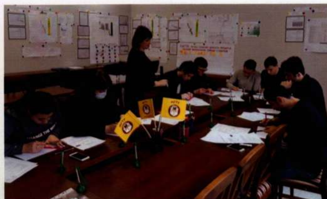
Студенческая проектная группа в проектом офисе МГТУ: работа над дорожной картой