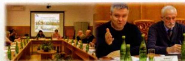
Рабочая встреча ректора МГТУ с руководителями предприятий-партнеров и участниками проектного обучения