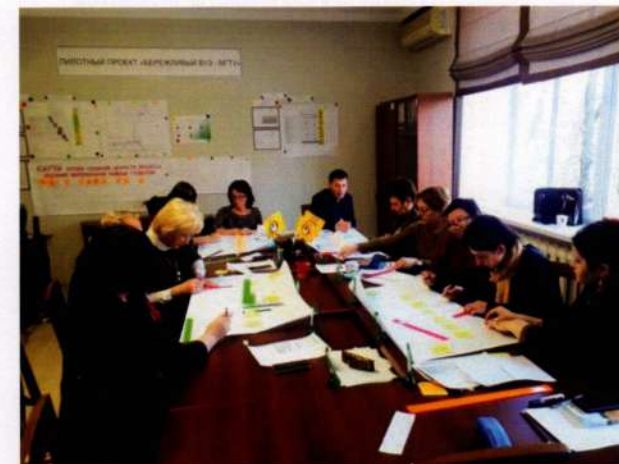
Обучение преподавателей – кураторов проектных групп