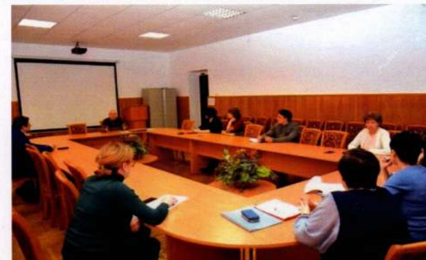
Заседание рабочей группы проекта «Внедрение системы проектного обучения»