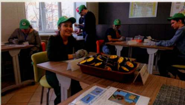
Обучение студентов в рамках проектного обучения на Фабрике процессов