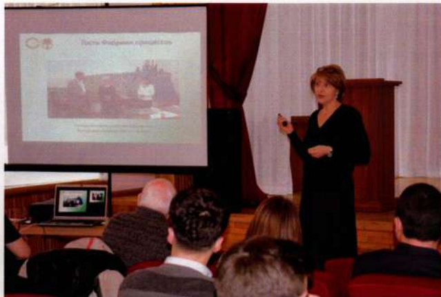
Организационное собрание рабочей группы со студентами, обучающимися по пилотным направлениям проекта, презентация проектного пула